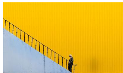
© Elena Georgiou, My City EEA